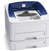
Phaser 3250 illustrée avec le Magasin 2 en option