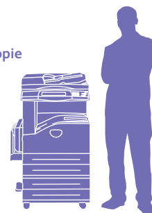
WorkCentre 5230 avec module Deux magasins