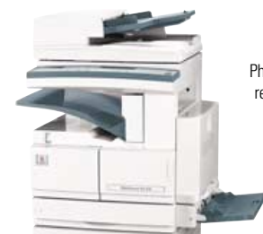
Photocopieur/Imprimante recto-verso WorkCentre Pro 416Pi