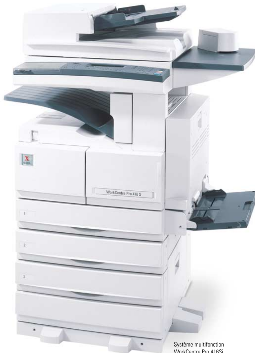
Système multifonction WorkCentre Pro 416Si