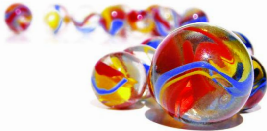
Des couleurs extraordinaires grâce à l'encre solide.