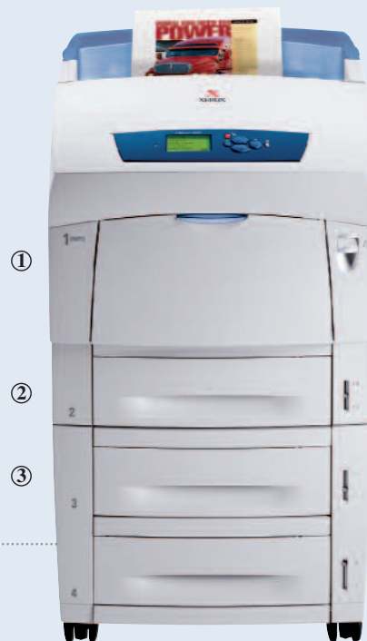
Imprimante couleur Phaser 6250DX

Une option rapide d'impression recto-verso vous permet de faire des économies (en standard sur les configurations DP, DT et DX).